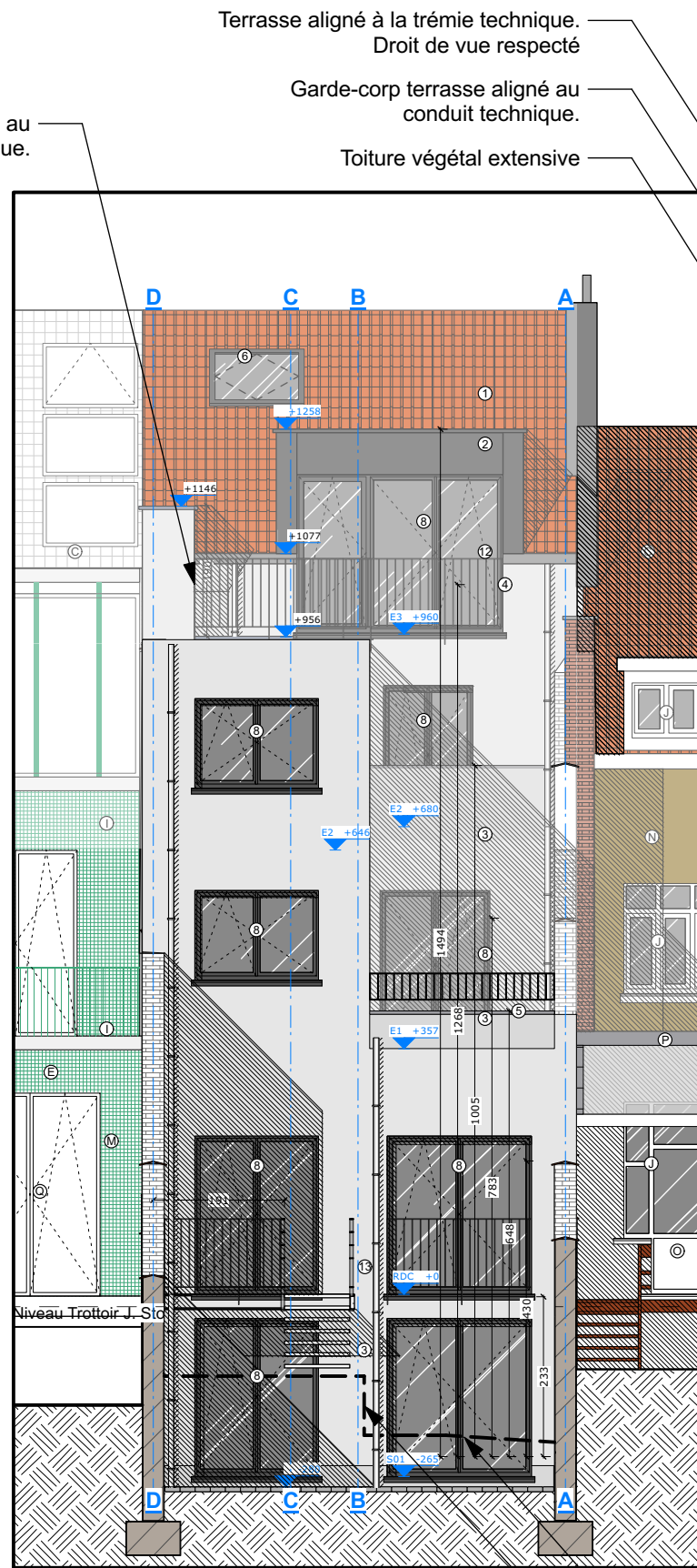
Façade arrière | Achtergevel 1:100